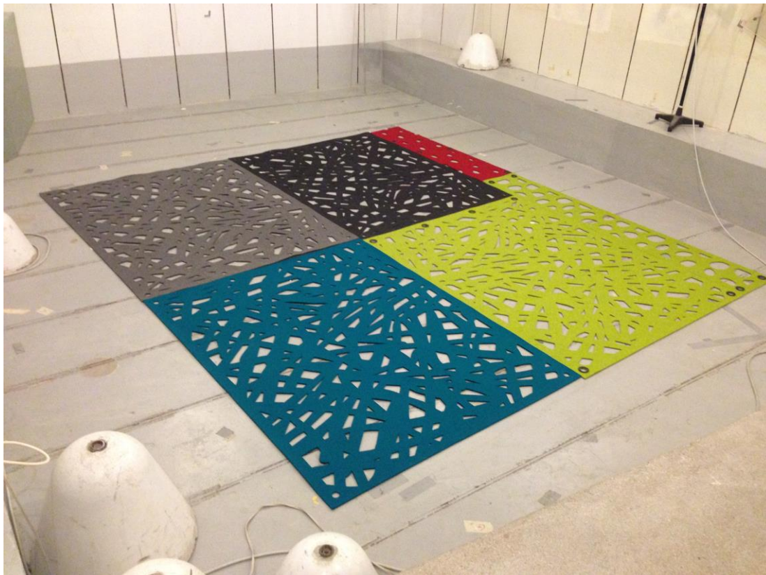
Figur 1 Billede af montagen af prøveemnet i laboratoriet.